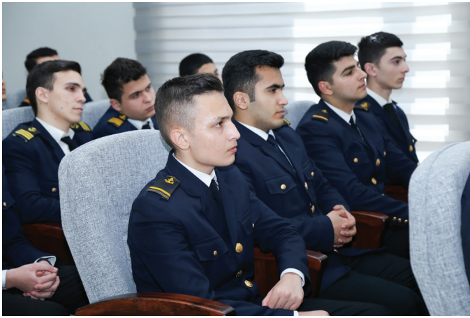
“Azərbaycan Xəzər Dəniz Gəmiçiliyi” QSC-nin (ASCO) Azərbaycan Dövlət Dəniz Akademiyasında tələbələr üçün “Müasir dənizçilik dünyasına baxış” mövzusunda seminar keçirilib.