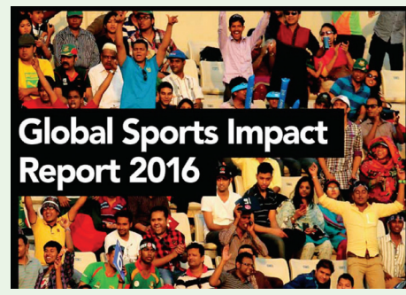
Global Sports Impact Report 2016

İlk üçlükdə də dəyişiklik olub. Ötən il beşinci olan ABŞ (39262) bu dəfə liderliyi ələ keçirib. İkinci Rusiya, üçüncü yerdə isə