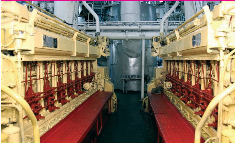
“Azərbaycan Xəzər Dəniz Gəmiçiliyi” QSC-nin Ro-Ro tipli “Bəstəkar Fikrət Əmirov” gəmisi əsaslı təmirdən çıxıb.

Bu, cari ildə “Zığ” Gəmi Təmiri Zavodunda beynəlxalq tələblərə uyğun təmir olunan sayca 22-ci gəmimizdir.