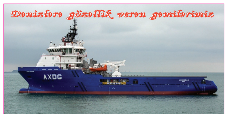
Dənizlərə gözəllik verən gəmilərimiz

Sonda qaliblərə diplom və medallar təqdim edilib.